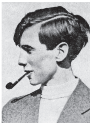
ALEXANDER SCHMORELL Etudiant en médecine (16 sept. 1917 - 13 juil. 1943)