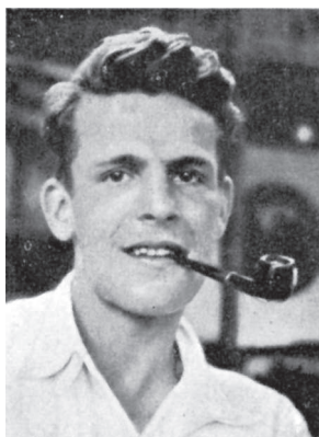
CHRISTOPH PROBST Etudiant en médecine (6 nov. 1919 - 22 fév. 1943)