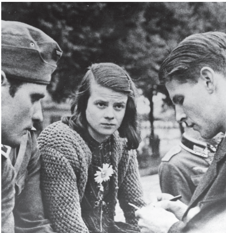
Hans Scholl, Sophie Scholl, Christoph Probst, au cours de l'été 1942.