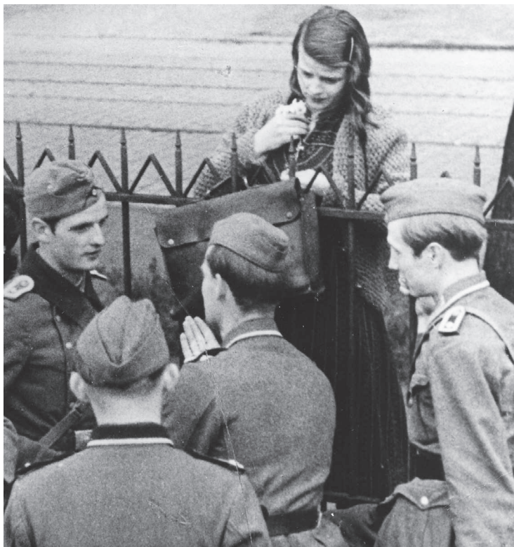
A la gare de Munich, au cours de l'été 1942 : de gauche à droite, Hans Scholl, Willi Graf (de dos), un militaire non identifié, Sophie Scholl et Alexander Schmorell.