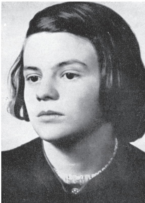
SOPHIE SCHOLL Etudiante en philosophie (9 mai 1921 - 22 fév. 1943)