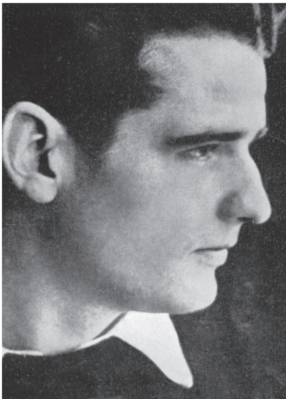
HANS SCHOLL Etudiant en médecine (22 sept. 1918 - 22 fév. 1943)