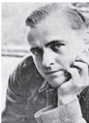
WILLI GRAF Etudiant en médecine (2 janv. 1918 - 12 oct. 1943)